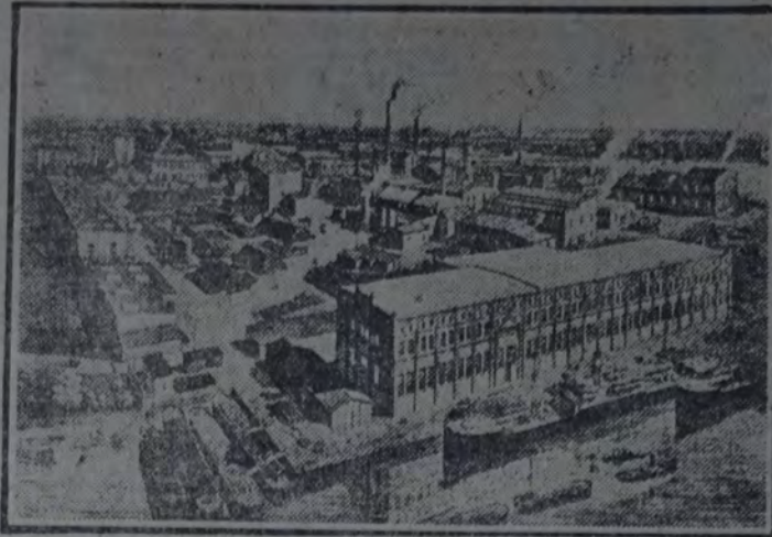
Завод Минеральных Масел А. Эльриха и Ко., Рига. Fotografía de la fábrica de aceites lubricantes en Riga.

EDUARDO CASTEX L TDA SOC. AN. COMERCIAL E INDUSTRIAL SARMIENTO 320 U. T. 6122 AVENIDA